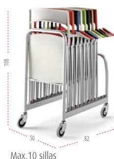
Max. 10 sillas

Altura Total: de 790 mm Anchura Total: de 470 mm Profundidad total: de 540 mm Altura Asiento: de 460 mm Anchura Asiento: de 420 mm Profundidad Asiento: de 460 mm